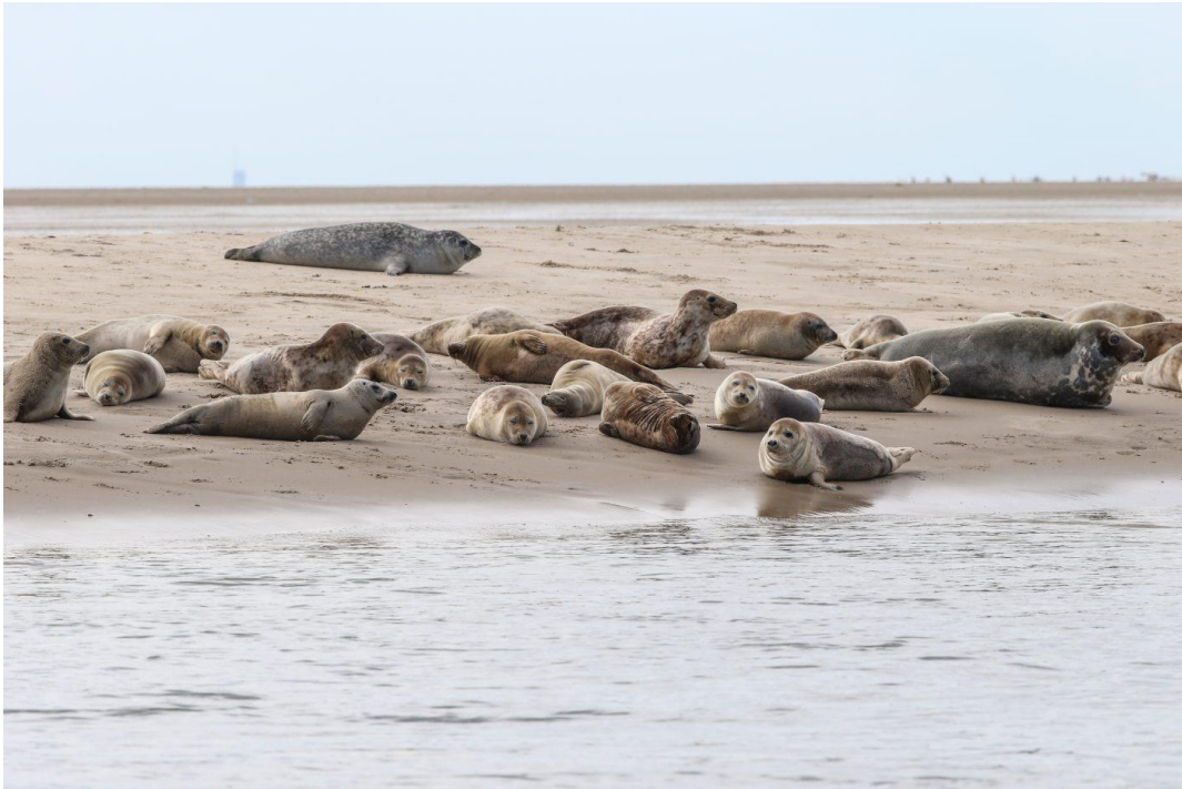
Op een kleine twintig minuten varen liggen de zandbanken waar de zeehonden zich opwarmen... Prachtig!