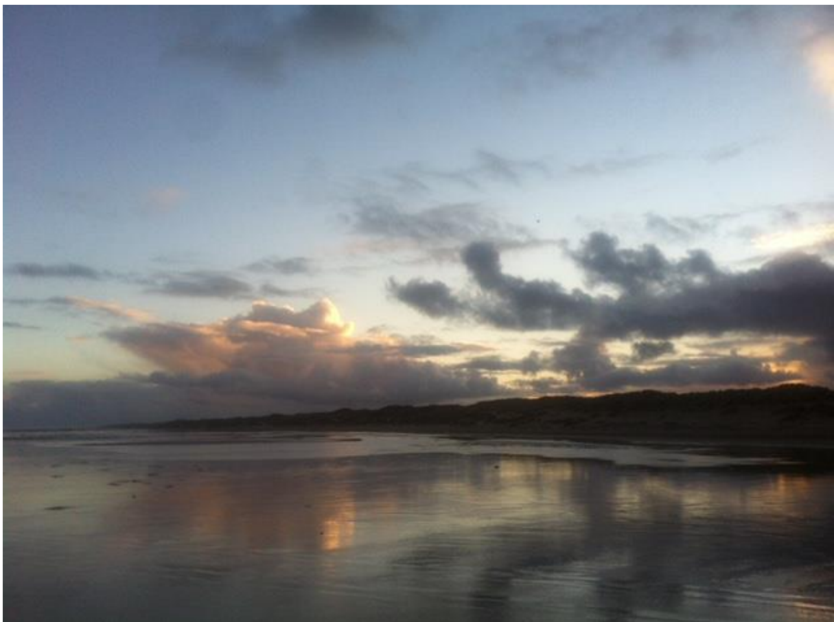
Strand bij Paal 9.8 West aan Zee

Op West zit een SPAR in de Boomstraat. Kleiner assortiment maar wel mooie groenten afdeling.